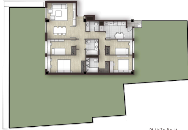
PLANTA BAJA VIVIENDA+JARDIN PRIVADO